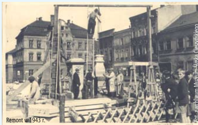
Remont w 1943 r.