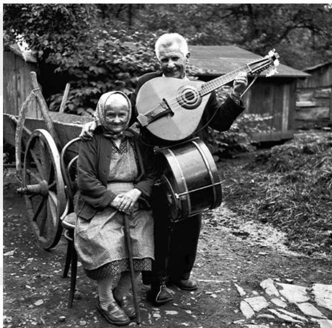
Fot. Jan Grabowski - Wiejski grajek i Zimowe Beskidy